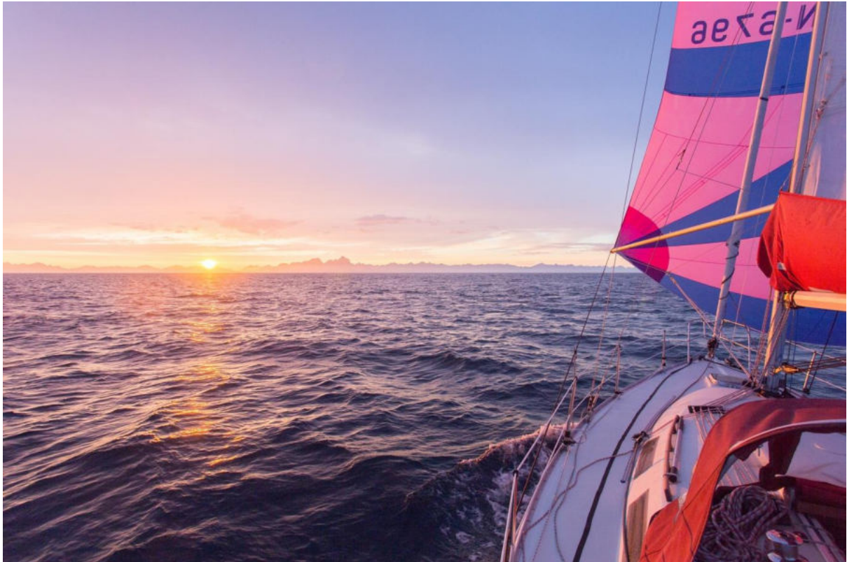
Spinnarkersegling i Vestfjorden

Efter Vestfjorden var det bara 200nm kvar hem i välkända farvatten. Med oss från vår seglats tar vi med oss att